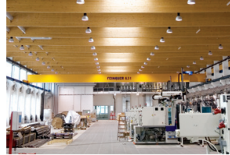
Der Betrieb von Playmobil in Dietenhofen im Bau

Der Betrieb prüfte sowohl die gravimetrisch als auch die volumetrisch gesteuerten Systeme. „Beide bieten die gleiche Mess- und Wiederholgenauigkeit aber nur das gravimetrische System bietet die kontinuierliche Überwachung des Gewichtsverlustes“, sagt Herr Stürzenhofecker. „Die gravimetrisch gesteuerten Geräte beeindruckten uns durch ihre bequeme Bedienung und ihre kontinuierliche Gewichtskontrolle, aber am meisten beeindruckte uns die Zeitersparnis beim Farbwechsel.“