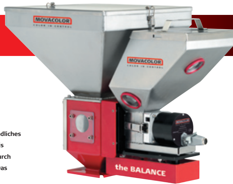
MC-Balance, gravimetrisches Einkomponenten-Dosiergerät für Spritzguss und Extrusion